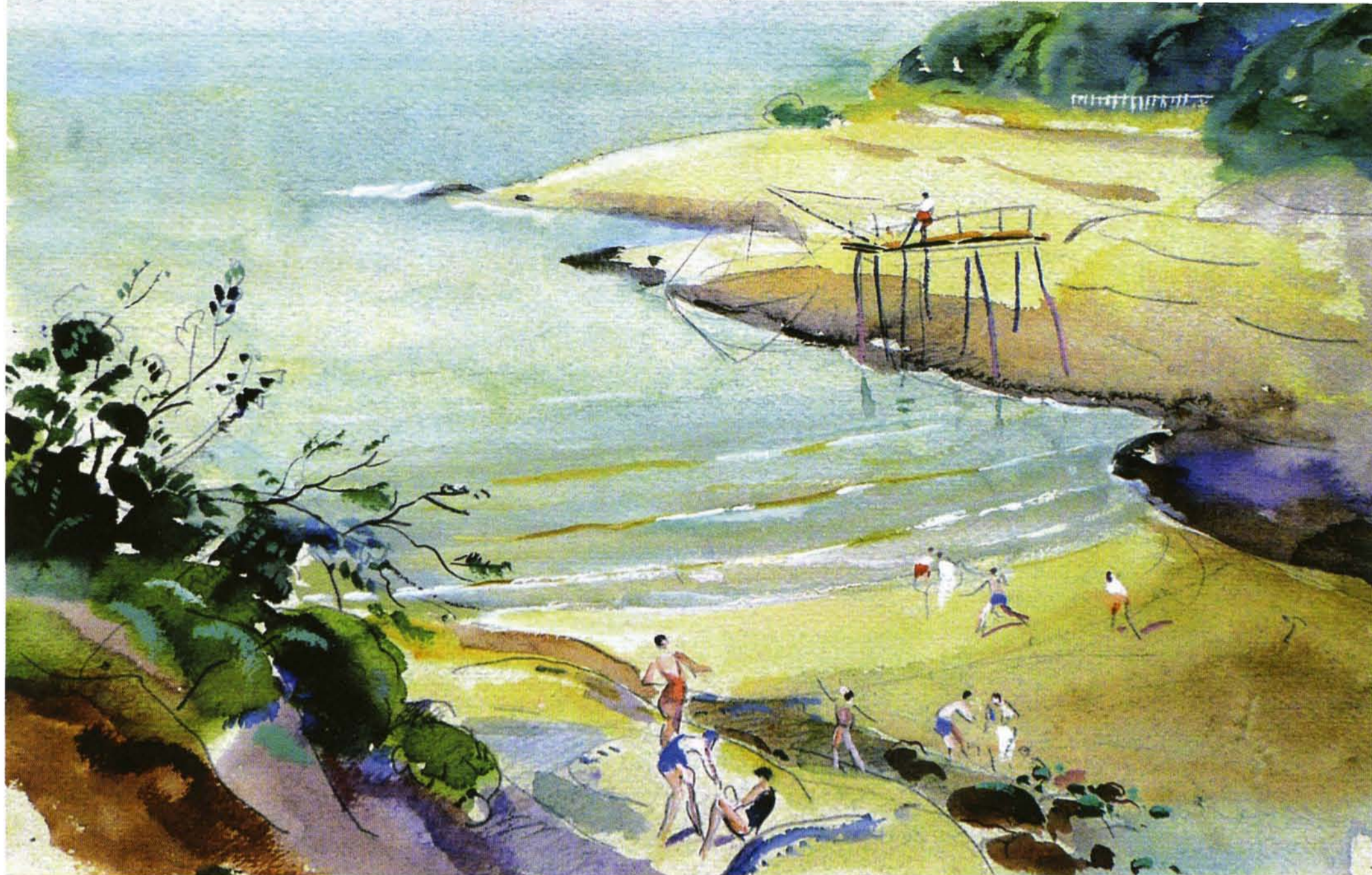
Baigneurs et pêcheur au carrelet, plage du Conseil, aquarelle et crayon, coll. particulière